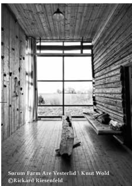
Sorum Farm Are Vesterlid \ Knut Wold

A tradition in Norwegian architecture emphasizes tactile and spatial experiences and reflects the relationship between buildings and landscape. Sensitivity to place, experimental tectonics and profound attention to detail characterize the tradition. Norwegian architecture is challenged by new dense urban development in major cities. Contemporary projects situated in different geographical parts of Norway comprise the exhibition, ranging from small infrastructure projects to a hydro power station in the mountains, individual buildings in rural and urban landscapes, and works by old masters. The selection of works has been based on the asBUILT book series. An exhibition by Deutsches Architekturmuseum (DAM) in cooperation with Guest of Honour Frankfurt Bookfair 2019 Norway, Norwegian Literature Abroad (NORLA), The Oslo School of Architecture and Design (AHO), Pax Forlag, and Buchmesse Frankfurt. The curator is Nina Berre, B+E Curating Architecture and Urbanism.