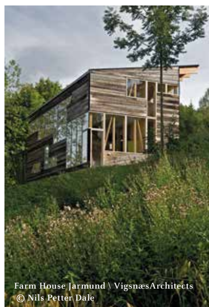
Farm House Jarmund \ Vignæs Architects