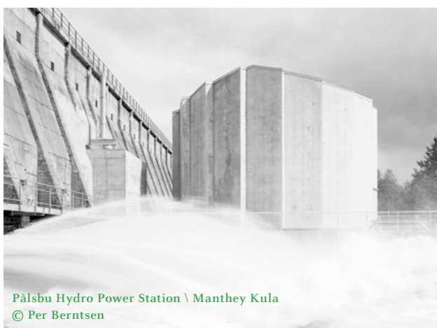
Pålsbu Hydro Power Station \ Manthey Kula