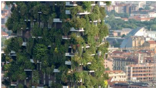
DAM_EinfachGruen_Bosco Verticale_Stefano Boeri

Pressebilder – honorarfrei für die einmalige, rein redaktionelle Nutzung im direkten Kontext und über die Dauer der Ausstellung EINFACH GRÜN bis 11. Juli 2021 unter Nennung des Urhebers