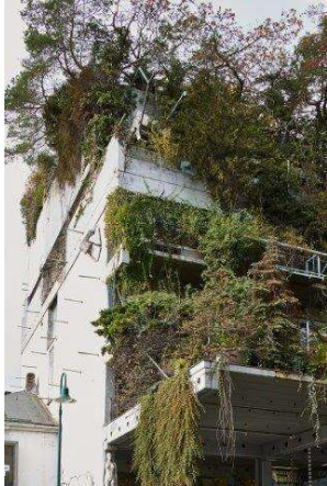
DAM_EinfachGruen_Baumhaus Darmstadt_Ot Hoffmann

Pressebilder – honorarfrei für die einmalige, rein redaktionelle Nutzung im direkten Kontext und über die Dauer der Ausstellung EINFACH GRÜN bis 11. Juli 2021 unter Nennung des Urhebers