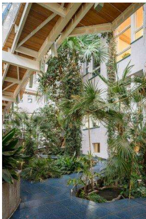
DAM_EinfachGruen_Oekohaus Frankfurt_Eble Sambeth Loidl Wilkes

ingenhoven architects, Düsseldorf, Deutschland, 2020