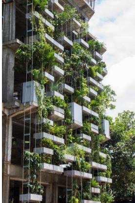
DAM_EinfachGruen_Urban Farming Office_VTN Architects

Pressebilder – honorarfrei für die einmalige, rein redaktionelle Nutzung im direkten Kontext und über die Dauer der Ausstellung EINFACH GRÜN bis 11. Juli 2021 unter Nennung des Urhebers