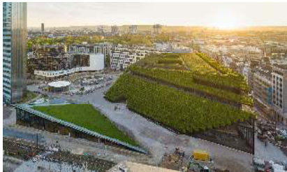
DAM_EinfachGruen_Koe-Bogen II_ingenhoven architects_Foto_HGEsch

Barkow Leibinger Raderschallpartner AG, Freiburg, Deutschland, 2013 Foto: Stefan Müller