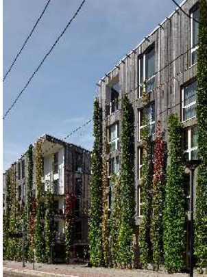
DAM_EinfachGruen_Stadthaus M1_Barkow Leibinger

Pressebilder – honorarfrei für die einmalige, rein redaktionelle Nutzung im direkten Kontext und über die Dauer der Ausstellung EINFACH GRÜN bis 11. Juli 2021 unter Nennung des Urhebers