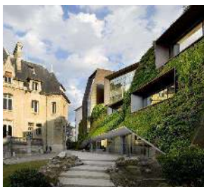
DAM_EinfachGruen_Chambre de Commerce_Chartier Corbasson_Foto_Chartier+Corbasson